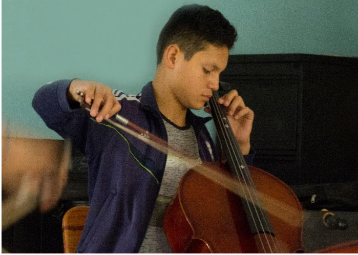
Orquesta Concertando México- Ciudad de los Niños